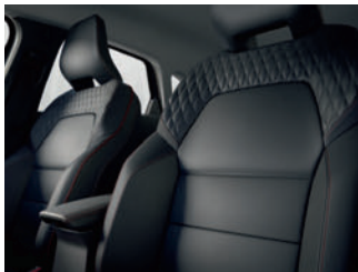
Sellerie Cuir Noir iconic