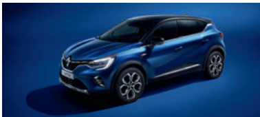
Bleu Iron (1)