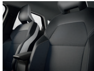
sellerie TEP / tissu avec jonc Gris