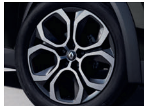
jantes alliage 18" Pasadena diamantées gris erbé