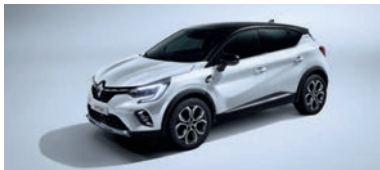
Blanc Nacré (1)