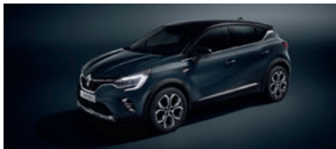
Bleu Marine Fumé (2)