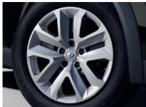
enjoliveurs 17" Nympha