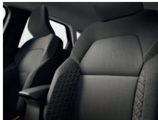
sellerie équilibre tissu gris et noir