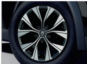
jantes alliage 17" Eridis