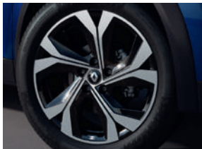
jantes alliage 18" Le Castellet R.S. Line