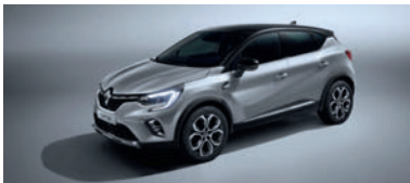
Gris Highland (1)