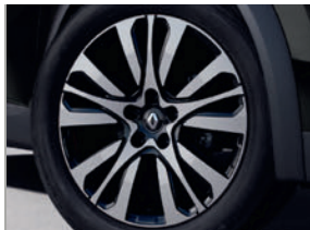
jantes alliage 18" iconic diamantées noires