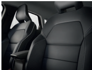
sellerie cuir carbone foncé