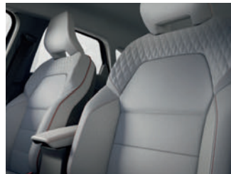
Pack signature gris sellier