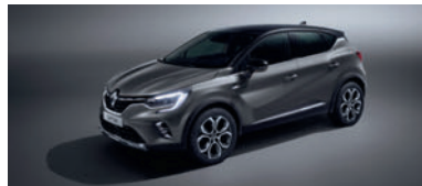
Gris Cassiopée (1)