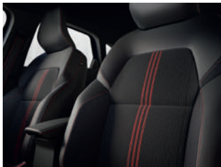
sellerie spécifique R.S. line