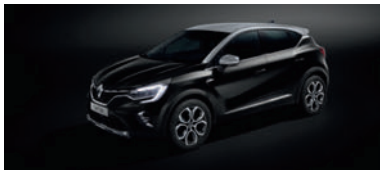
Noir Étoilé (1)