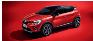
Rouge Flamme (1)